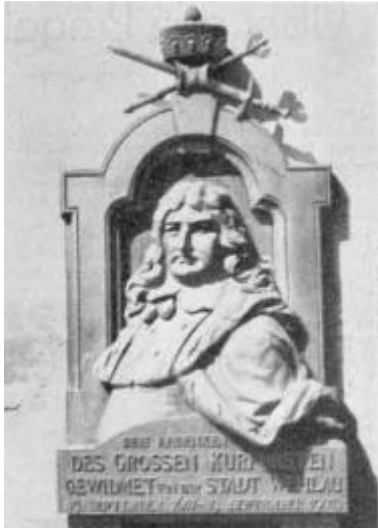
Das Kurfürsten-Relief am Rathaus in Wehlau.