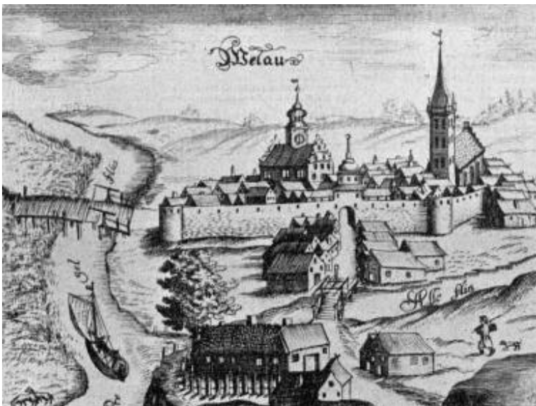
In dem Ende des 17. Jahrhunderts erschiedenen Werk „Alt- und Neues Preußen“ von Hartknoch hat der Zeichner die Stadt so wiedergegeben, wie wir das auf dem Bilde sehen.