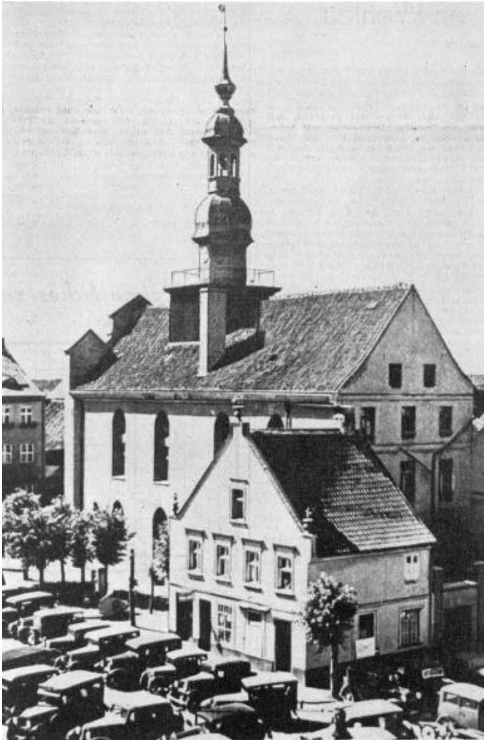
Das Rathaus von Wehlau

Im Rathaus von Wehlau wurde am 19. September 1657 der Vertrag unterzeichnet, der die uneingeschränkte Souveränität Preußens festlegte. Der Bau — er ist aus einem anderen Blickwinkel auch auf dem Bild zu sehen, das wir auf Seite 11 Preußens testlegte. Der Bau — er ist aus einem anderen Blickwinkel auch auf dem Bild zu sehen, das wir auf Seite 11 bringen — ist der Überlieferung nach das Haus, das in der zweiten Hälfte des 14. Jahrhunderts errichtet und nach Bränden 1555 und 1725 bis 1726 erneuert wurde. Durch verschiedene Umbauten im 19. Jahrhundert wurde das Rathaus sehr entstellt, doch wurden die gotischen Teile im Wesentlichen bewahrt. Unsere Aufnahme zeigt die Südfront. Die Westfront (auf dem Bilde auf Seite 11 sichtbar) war am besten erhalten — ist der Überlieferung nach das Haus, das in der zweiten Hälfte des 14. Jahrhunderts errichtet und nach Bränden 1555 und 1725 bis 1726 erneuert wurde. Durch verschiedene Umbauten im 19. Jahrhundert wurde das Rathaus sehr entstellt, doch wurden die gotischen Teile im Wesentlichen bewahrt. Unsere Aufnahme zeigt die Südfront. Die Westfront (auf dem Bilde auf Seite 11 sichtbar) war am besten erhalten.