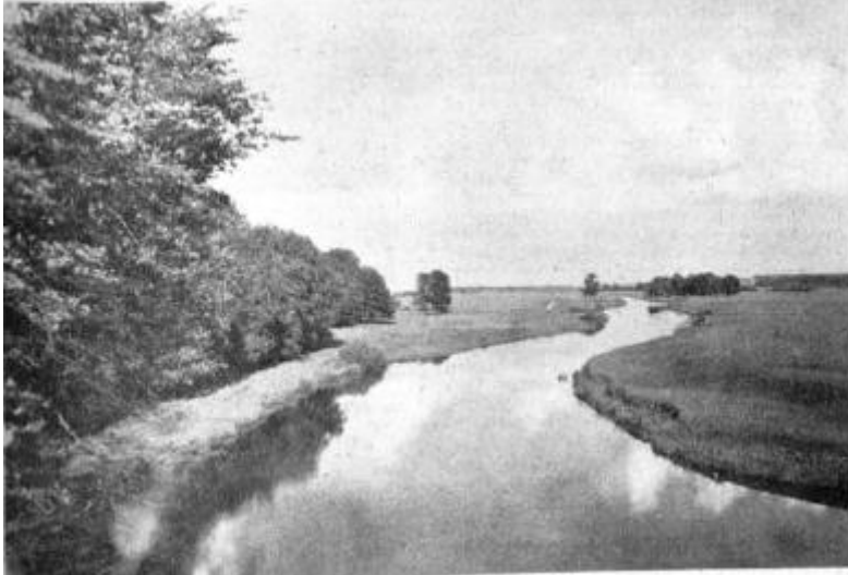
Ein Blick auf das Pregeltal bei Taplacken