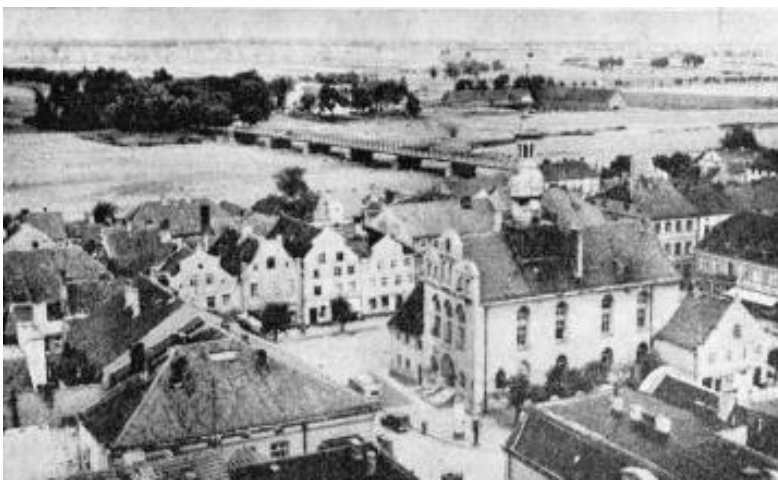
Eine Vorstellung von der reizvollen Lage gibt das Bild, das einen Blick von der Kirche St. Jacobi über Markt und Rathaus auf das Pregeltal mit der Langen